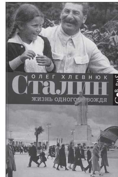
Обложка книги Book cover

Конечно, в анализ такого сложного и достаточно продолжительного периода правления невозможно было, по словам самого автора, «втиснуть даже упоминания обо всех сколько-нибудь значимых событиях сталинского периода». Наверное, многим, как и автору рецензии, может показаться недостаточно отраженным такой важный аспект становления сталинского авторитаризма, как «кадровая революция», проведенная в регионах страны в конце